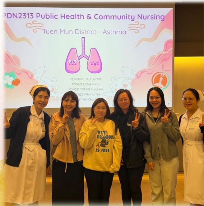
PDN6 PDN2313 專案示範 合照